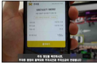
4) 自動タイムカウント