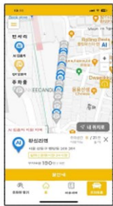
1) 空きスペース確認可能