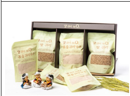
〈炒めオート麦粉・オート麦芽殻セット〉